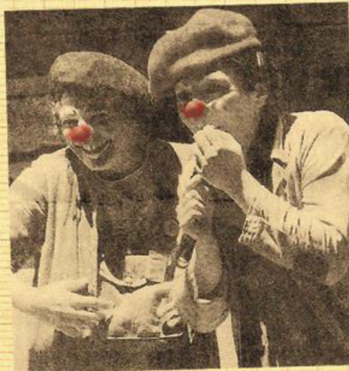
ESPIÈGLES. Paradoxe de comédienne : faire le clown ou être clown.